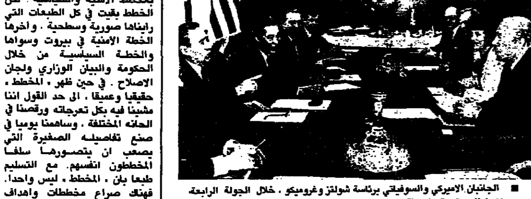
الجانبان الأميركي والسوفياتي برئاسة شولتز وغروميكو، خلال الجولة الرابعة من المحادثات في مقر البعثة الأميركية

اختتم وزير الخارجية الأميركي جورج شولتز والسوفياتي أندريه غروميكو محادثتهما التي استمرت يومين للتوصل إلى اتجاه جديد للحد من التسلح بعد اجتماع لم يكن مقررا عقدها سواء وكان الوزيران اللذان يقفان أمام محادثات من الحد من الأسلحة النووية بين القوتين العظميين منذ ١٣ شهرا قد اجتمعا في مقر البعثة السوفياتية في جنيف لمدة ساعتين و٢٠ دقيقة وسط تضييق إعلامي مشدّد، وكذا قد أجري محادثات استمرت سبع ساعات أمس والأولى. ورفض مسؤولون أميركيون وسوفيات بلتزمون بقول بالحد من المعلومات أكثر من ٨٠٠ صفحي يغطون أبحاث المحادثات المتعلقة مع الجولة الأخيرة على الرغم من أن ديبلوماسيين غربيين قالوا أن قرار عقد